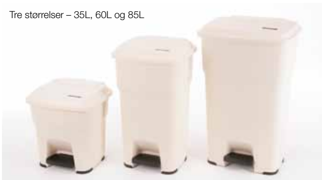
Tre størrelser – 35L, 60L og 85L