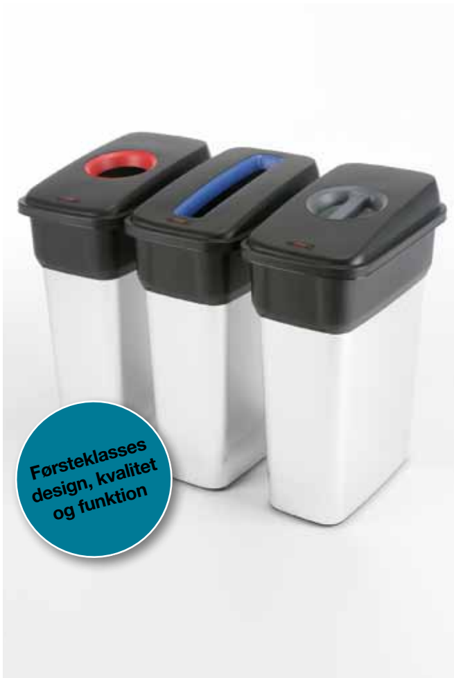
Geo – medium (55L) og stor (70L)