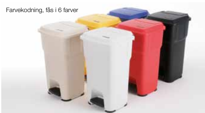
Farvekodning, fås i 6 farver