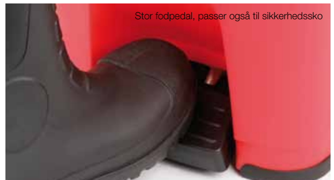
Stor fodpedal, passer også til sikkerhedssko