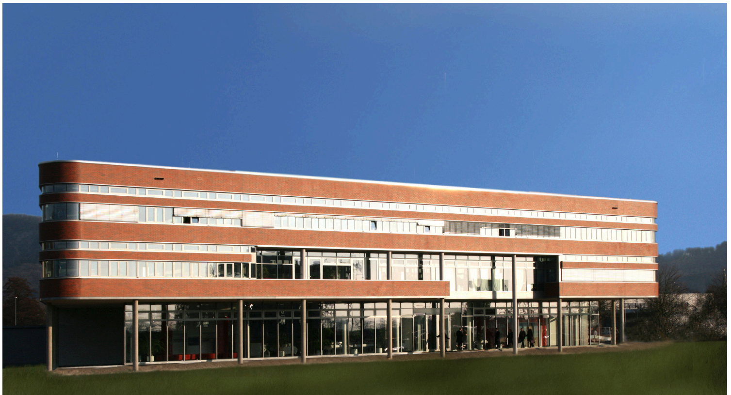
Gesamtansicht des Gebäude

Zertifiziert wurde das Bürogebäude der Freudenberg Haushaltsprodukte KG, besser bekannt unter dem Markennamen VILEDA, in Weinheim. Ein aus einem Wettbewerb hervorgegangenes Vorhaben des Büros, welches in enger und intensiver Zusammenarbeit von Architekten und Ingenieuren von der Wettbewerbsidee bis zur Realisierung betreut wurde.